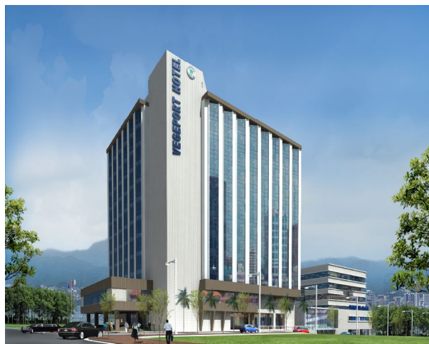
Mô hình Văn phòng - Trung tâm Thương mại Kim Thành Lào Cai